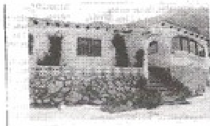
UIT DE PASTORIE