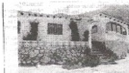
UIT DE PASTORIE